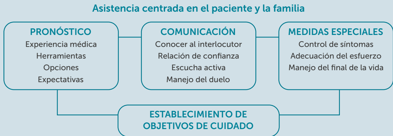
Figura 1. Principios básicos y prácticas recomendadas en Cuidados Paliativos

La atención centrada en el paciente y la familia tiene como objetivo conocer la dinámica psicosocial, las preferencias en cuanto a la cantidad como la calidad de vida esperable analizando el impacto de las posibles secuelas del ictus sobre la calidad de vida, así como las necesidades y los valores individuales de los pacientes y familiares. Estos valores se han de respetar en la toma de decisiones clínicas, que debería tener lugar de manera conjunta. 18